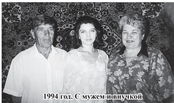
1994 год. С мужем и внучкой